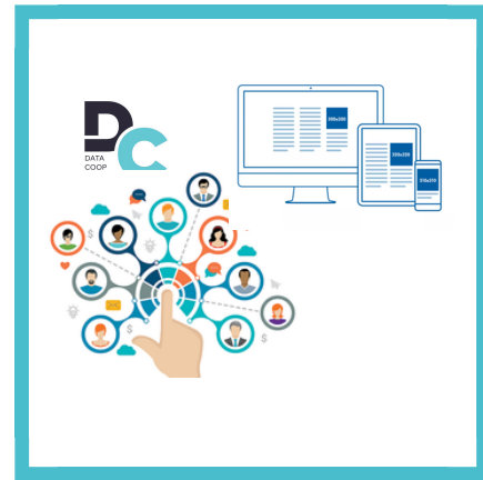
Campagne Budget / Dates / Audiences / Créatifs /