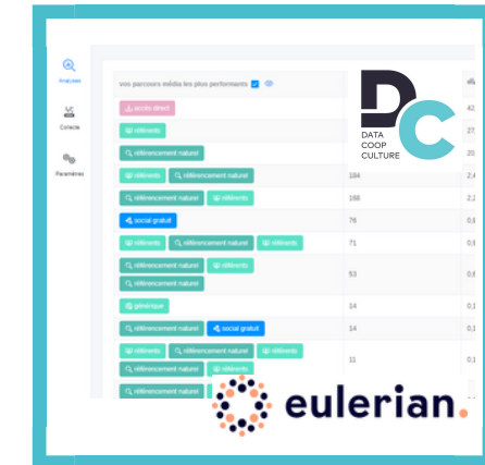
Rapports / Tableaux de bord performance numérique